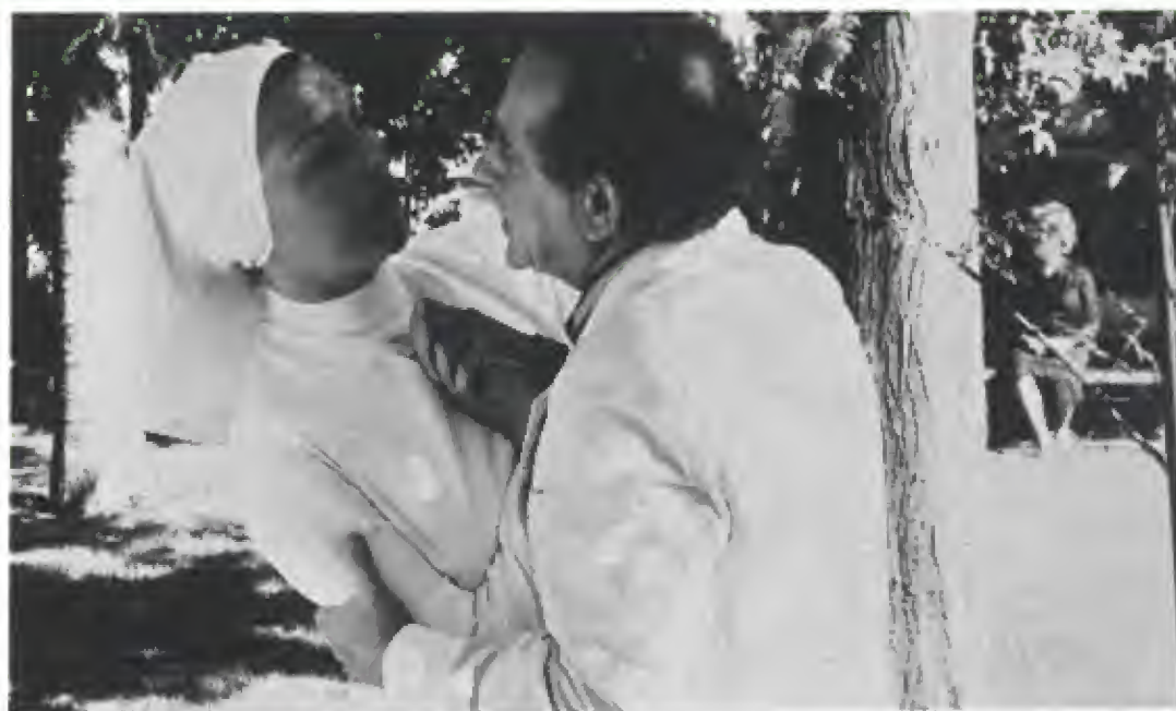
Esperanza Roy - Quique Camoiras